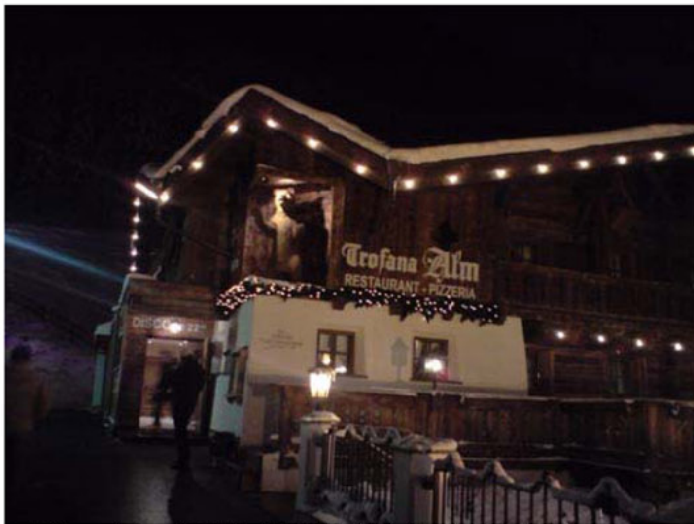
Zur Wintersportsaison in Ischgl hat die MIB GmbH die Ausschank-Kontrolle der Fass-Biergetränke in der Trofana Alm auf den neusten Stand gebracht.