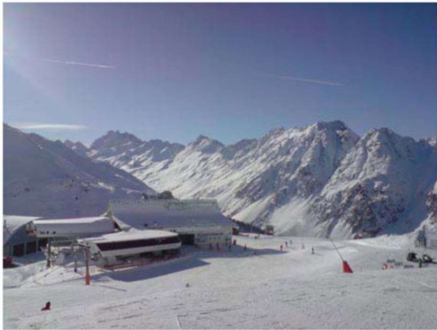
Wenn die Wintersportler von den Ski-Pisten in die Bars strömen, sollte der Getränke-Ausschank problemlos funktionieren.

Zur diesjährigen Wintersport-Saison-Eröffnung hat die MIB GmbH Messtechnik & Industrieberatung aus Ihringen in der Après-Ski Bar „Trofana Alm“ in Ischgl ein modernes Ultraschalldurchflussmessgerät für die Ausschank-Kontrolle der Fass-Biergetränke installiert.